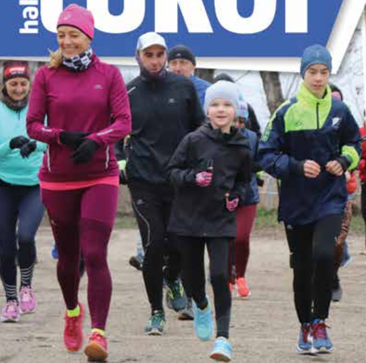
Futni még hidegben is lehet!