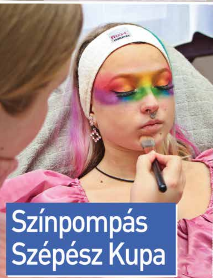
Színpompás Szépész Kupa