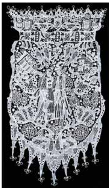
A Sissi kiállításon bemutatandó csipke. IV. Károly és Zita királyné kapta koronázási ajándékként.

Az elmúlt év a halasi csipke 120 éves jubileumának jegyében telt. Ennek keretében számos eseményre került sor határon innen és túl, sőt egy impozáns album is megjelent az évforduló tiszteletére. Az ünnepségsorozat erre az esztendőre is átnyúlik, a következő állomás Budapesten, a Városligetben, a Vajdahunyad várában lesz kora tavasszal. Szécsiné Rédei Évával, a Csipkeház igazgatójával beszélgettünk.