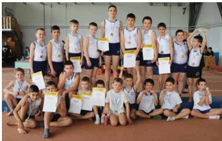
Sikeresek voltak a házigazda Fazekas tornászai

A Kiskunhalasi Fazekas Mihály Általános Iskola lehetett a házigazdája a torna diákolimpia vármegyei döntőjének. Nem véletlen, hogy éppen erre az intézményre esett a szövetség választása. A Fazekas évek óta ideális körülményeket teremt az ideérkező versenyeknek. A mostani megméretésen is szép halasi sikerek születtek, a fazekasos tornászok mellett a sziládys, a központis, a bibós és a kunfehértói versenyzők is továbbjutottak. A vármegyei döntő különlegessége volt, hogy hosszú évek után ismét volt lány tornaverseny is.