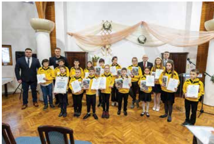
A Kertvárosi-iskola kapta a polgármesteri különdíjat