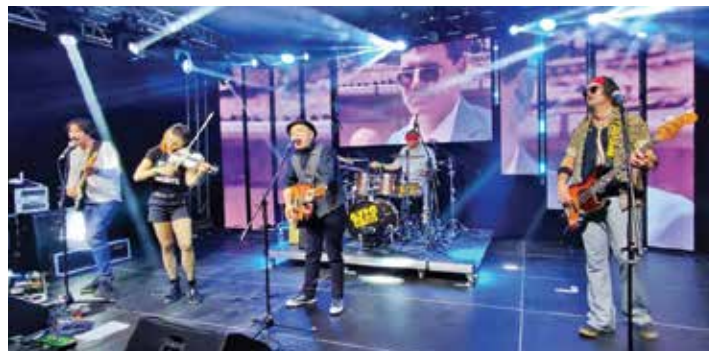
Színpadon a GyptoCircus