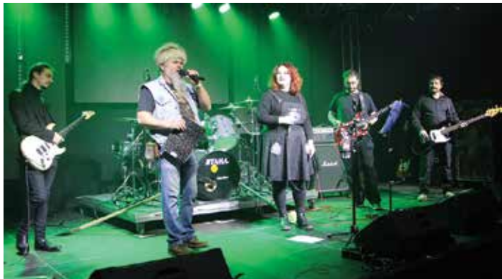
A műsorvezető felkonferálja a Rock Life zenekart

A kiskunhalasi Rockfarsangot 2023-ban is megszervezte a Voices zenekar. A stílus rajongói ezúttal a Tiszti Klub nagytermében gyűltek össze, hogy meghallgassák a hat fellépő zenekar koncertjeit. A minőségi élő zene mellett a résztvevők ezúttal is nagy hangsúlyt helyeztek az ötletes jelmezekre.