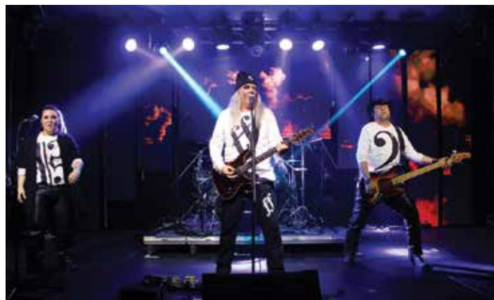
A házigazda Voices

nagy napra. A The Criples formáció tavaly februárban mutatkozott be először a halasi közönségnek. Most már visszatérő vendég-