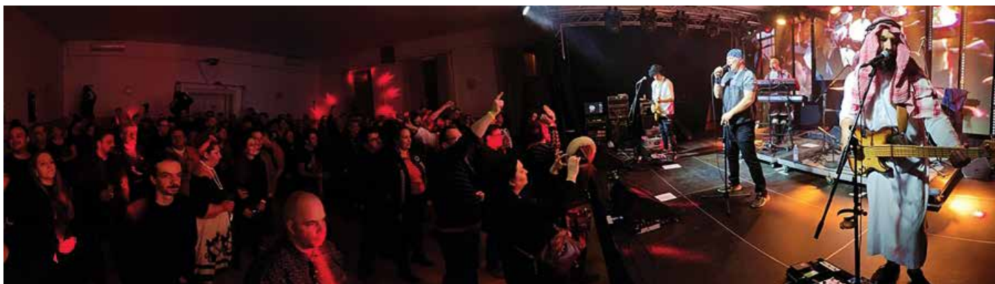
Rajongók a Don't Stop the Queen fellépésén