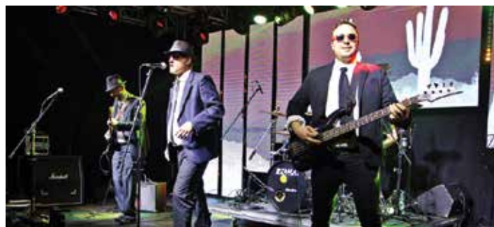
Légy a kaktuszban

A XIX. RockFarsang fellépésének sorát a Rock Life zenekar nyitotta meg. A Légy a kaktuszban formáció hosszú idő óta aktív résztvevője a februári rockrendezvénynek. Megjelenésükben ezúttal is a Blues Brothers világát idézték meg. Az, hogy városunkban már közel két évtizede megvalósul a Rockfarsang, a házigazda Voices zenekarnak köszönhető. Ők is ütős repertoárral készültek a