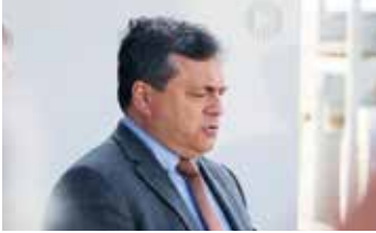
Bánya Gábor kormánybiztos