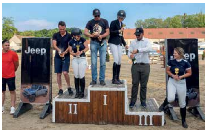
A ride and drive eredményhirdetése pezsgőzéssel