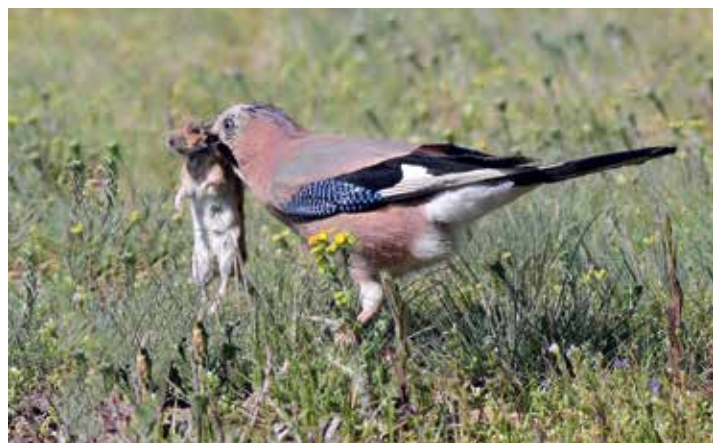
Szajkó a réten