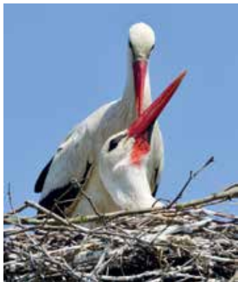
Az érzés öröme. Fehér gólya

„ Már a családomat is felkészítették az orvosok a legrosszabbra. Ötvenhat éves voltam. Visszajöttem, aztán a klinika után következett a deszki rehabilitáció, majd egy év táppénzt javasoltak, amellyel nem élttem teljes egészében. Három hónappal korábban munkára jelentkeztem. Mindig is aktív voltam, úgymond mozgékony, nagyon fel akartam épülni. Sikert, de megmondom őszintén megváltozott a világnézetem. Azt éreztem, hogy van még dolgom a világban, ekkor jött a képbe a fotózás.