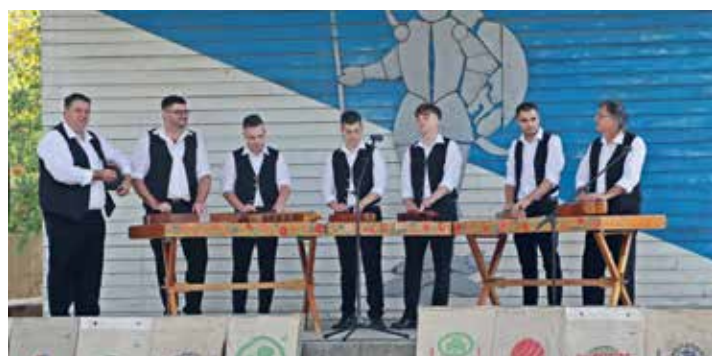
Színpadon a Balotai Citerazenekar