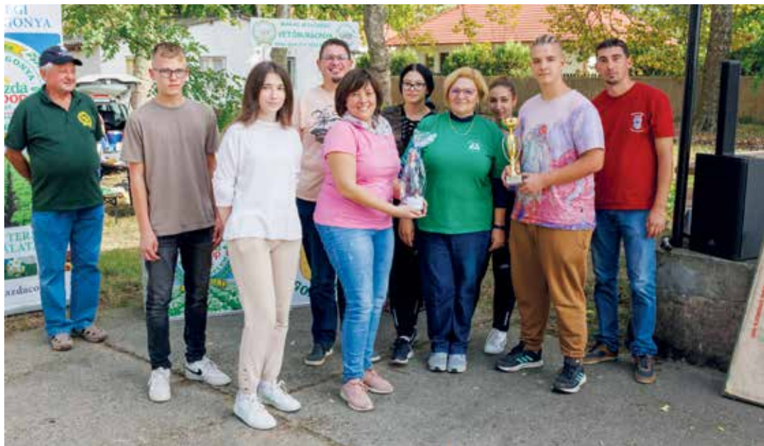
A győztes topolyai csapat