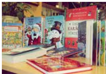
Már készülnek a karácsonyra