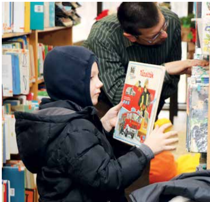
Minden korosztály megtalálja a neki tetsző könyvet

– A weboldalunkon és a Facebook oldalunkon keresztül is elérhetőek a könyvtár folyamatosan frissülő digitális tartalmai. A Kiskunhalas és környékének digitalizált dokumentumait tartalmazó helyismereti adatbázisunkat a Halaspress is folyamatosan építjük. A Face-