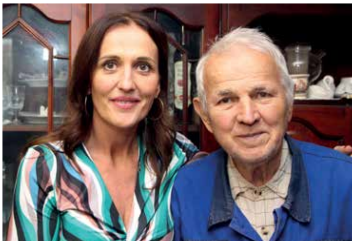
Az édesapja tette le a vállalkozás alapjait

pot is azért vezettem be, hogy el tudjak menni áruért. Egy éve van így. Ezt a napot igyekszem kihasználni mindenre, például ekkor járok fodrászhoz is.