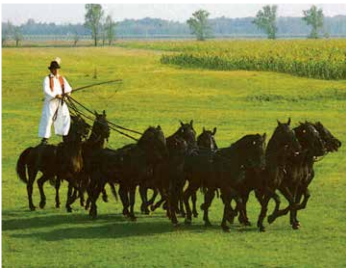
A pusztizes fogattal a pusztában

ben megszólalt a jól ismert „Boldog, boldog születésnapot dal...” és a tekintetek könnybe lábadtak. Szegedi Gábor tágra nyílt és csillogó szemekkel, a tőle megszokott egyenes tartással, meghatódva szemebesült a ténnyel, hogy itt bizony őt ünnepli a köze félszáz jóba-