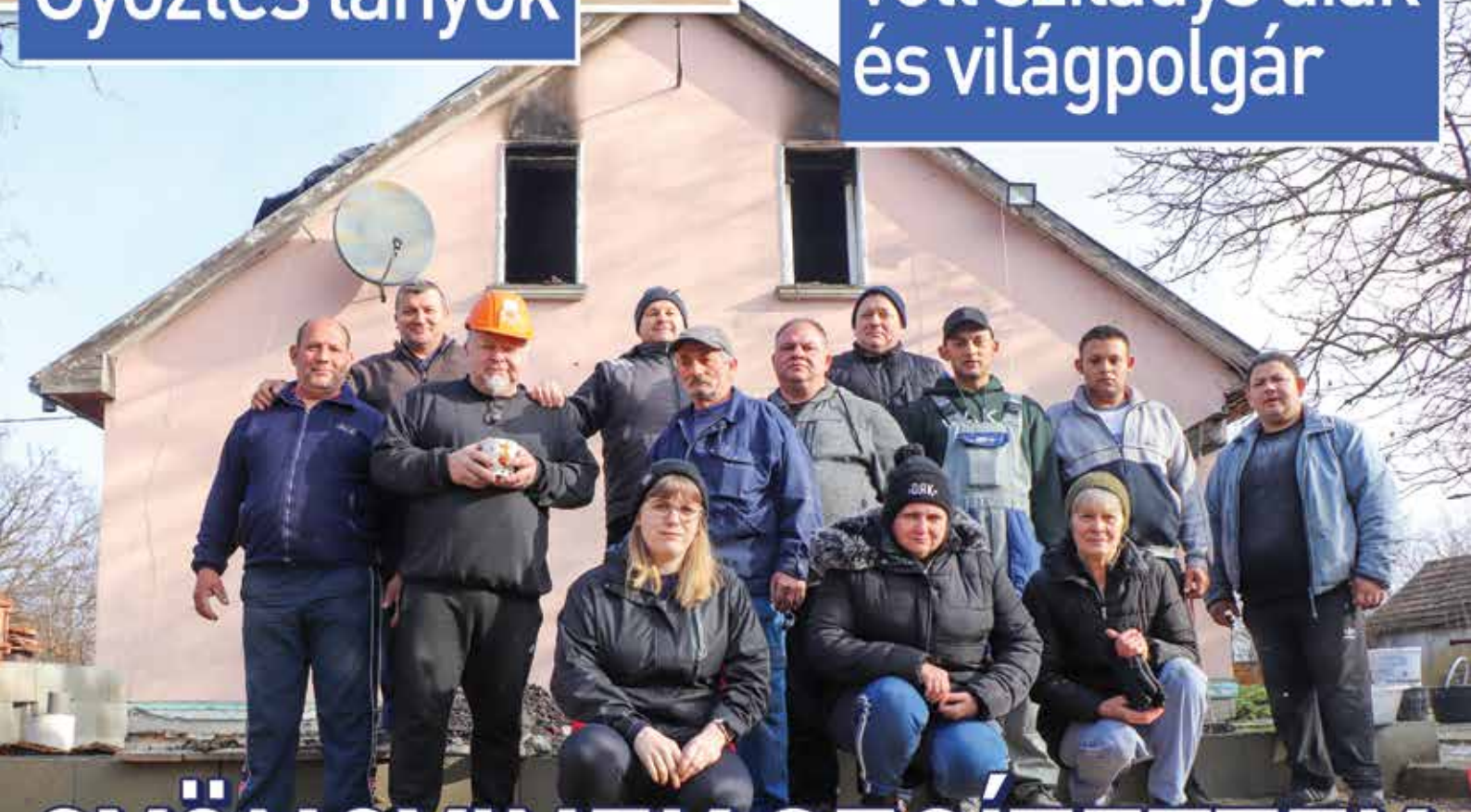
Volt sziládys diák és világpolgár