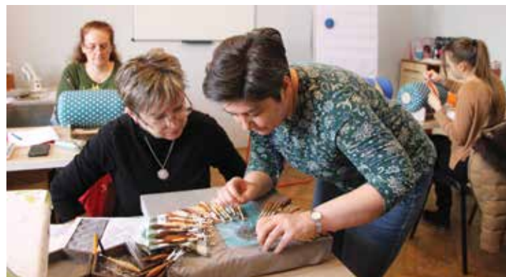
A workshopon vert csipke készült

▶ Hrivnák Tünde divattervező kollektívájának segítségével újra visszajött a csipke. Hogyan fogadtad, hogy újra megjelent ruházaton?